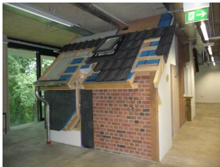
„Klimakammer“ von außen

Die „Klimakammer“ zeigt Möglichkeiten, diese von innen oder von außen energetisch zu ertüchtigen. Dabei wurden bekannte und weniger bekannte Konstruktionen eingebaut.