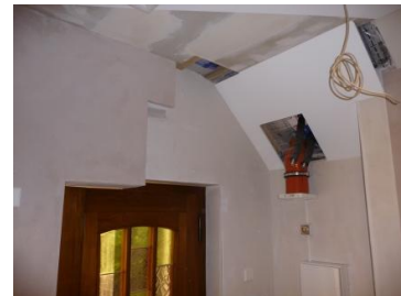
Durchdringungen von Strom-, Wasser- und Luftleitungen.

Die „Klimakammer“ zeigt Möglichkeiten, diese von innen oder von außen energetisch zu ertüchtigen. Dabei wurden bekannte und weniger bekannte Konstruktionen eingebaut.